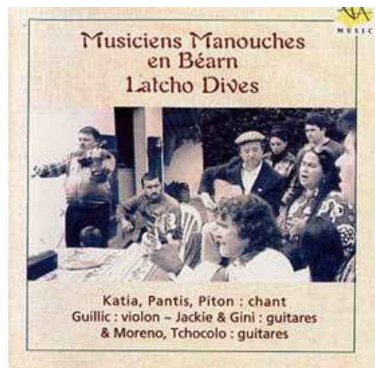
Musiciens Manouches en Béarn, Latcho Dives AIA CD 9906, dist. Médiasset.